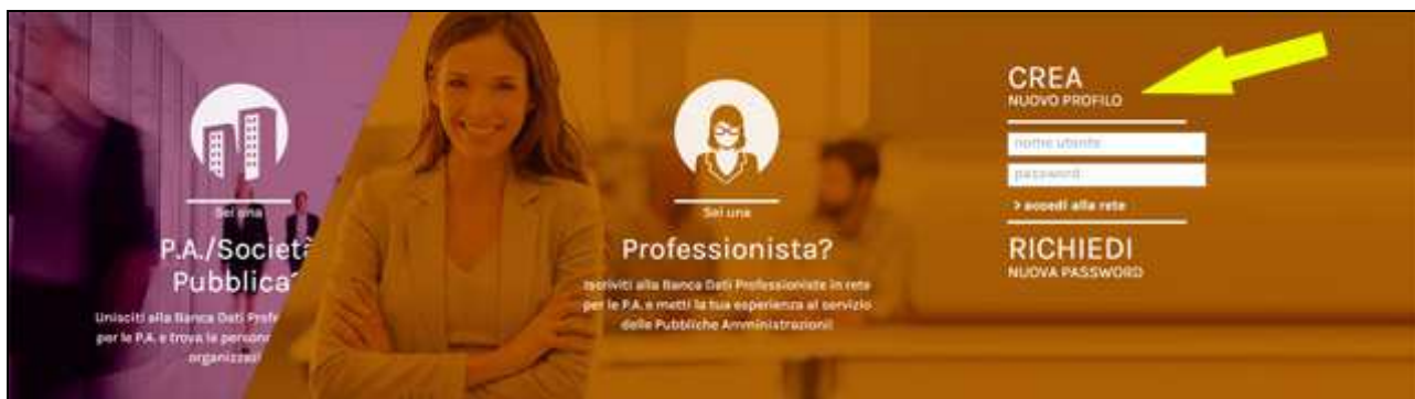
Figura 1 – Chiedere un profilo “Professionista”

e può essere raggiunto direttamente dalla “home page” premendo su “Crea nuovo profilo”