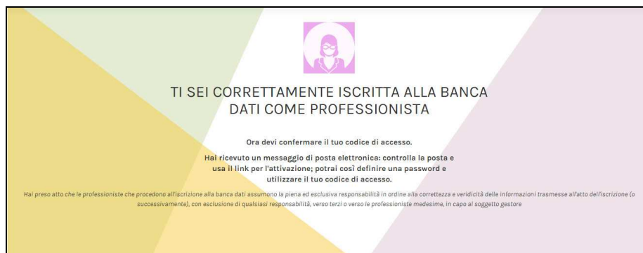
Figura 3 - Pagina di conferma

Premendo su “Crea nuovo profilo”, il profilo viene creato automaticamente, viene visualizzata una pagina di conferma, le credenziali di accesso vengono spedite via posta elettronica all’indirizzo specificato dall’utente.