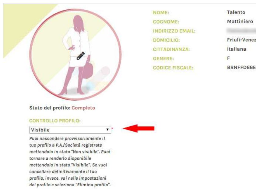
Figura 10 - Controllare la visibilità del profilo

In qualunque momento, la Professionista è in grado di “nascondere” il proprio profilo alle P.A./Società Pubbliche (ad esempio, perché sta apportando importanti modifiche al profilo, oppure semplicemente perché, per un periodo, preferisce non essere elencata nel motore di ricerca interno). Per decidere se il proprio profilo debba essere visibile o invisibile, esiste l’apposito campo “Controllo profilo”: